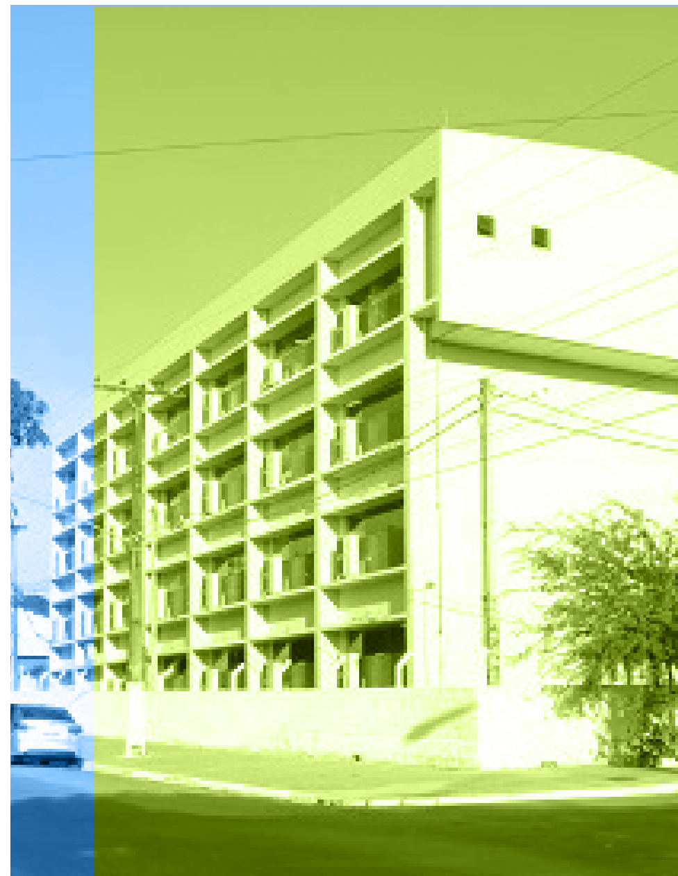
Prédio H do Iced visto pela Av. Presidente Cargas.