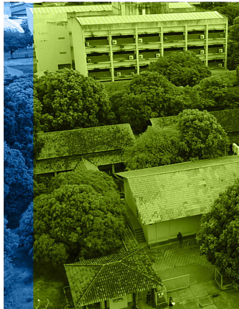
Vista aérea das instalações do Iced.

Finalizamos o plano apresentando as principais propostas de trabalho para a gestão do Instituto. As referidas propostas estão categorizadas em seis dimensões, com vistas a organizar os eixos de trabalho, mas com o entendimento de que as dimensões apresentadas não estão isoladas na estrutura do Iced, portanto, dependem de uma gestão que saiba desenvolver os eixos de forma concomitante e inter-relacionada. Destacamos ainda que, como todo plano, este também tem um caráter flexível, podendo ser ajustado ao longo do período de gestão, incluindo novas demandas, de acordo com as necessidades do Instituto.