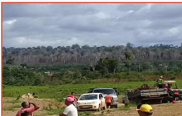
Dia de Campo em Plantio Mecanizado de Manivas de mandioca no Município de Mojui dos Campos, Pará.

PROJETO “Inovação Agrotecnológica em roçados de mandioca- Mojui dos Campos e Belterra.” , financiado pelo Ministério da Integração Nacional- Secretaria de Desenvolvimento Regional (SDR), cujo objetivo é realizar a mecanização agrícola de áreas da agricultura familiar na Bacia do Tapajós, através do projeto HORTIFRUTI TAPAJOS, do Curso de Agronomia, por meio da plantadora de maniva, que propicia maior conforto ao agricultor familiar, maior produtividade de raízes de mandioca, eficiência no uso da área e menor tempo no preparo dos solos, alavancando a cadeia de valor da mandiocultura na região.