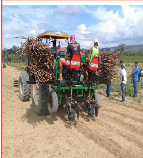
Plantio Mecanizado de Manivas de Mandioca, Município de Mojui dos Campos, estado do Pará