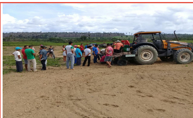
Regulando a profundidade dos discos e espaçamento entre eles para o plantio de manivas de mandioca. Mojui dos Campos, Pará.