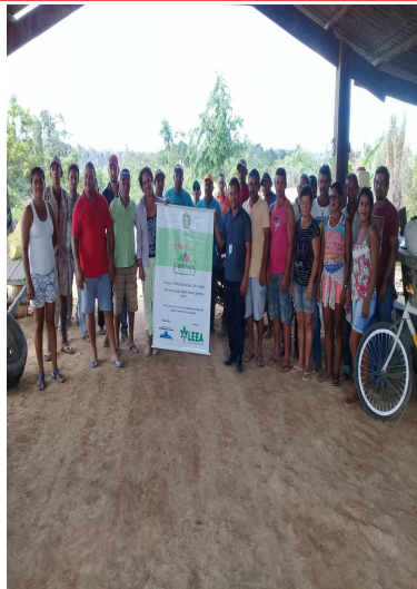
Inauguração das Unidades Demonstrativas na Comunidade de Riacho Verde (A) e Riacho Branco (B)