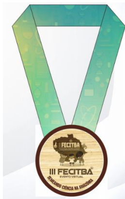
Figura 1 – Verso de medalha de premiação da III FECITBA.

Os resultados deve ser a maior seção do seu relatório, afinal, é ele que vai responder suas questões de investigação e dizer se suas hipóteses estavam certas ou erradas. Abaixo temos dois exemplos de como inserir figuras com a legenda e fonte. As letras dessa legenda e fonte são tamanho 10 e a obra citada na fonte deverá vir nas referências do final do relatório também.