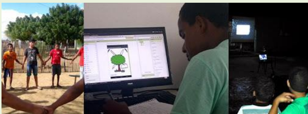
Figura 01 – Estudantes das Escolas Rurais de Família Agrícola – Participantes do projeto TECSOL-CDCR