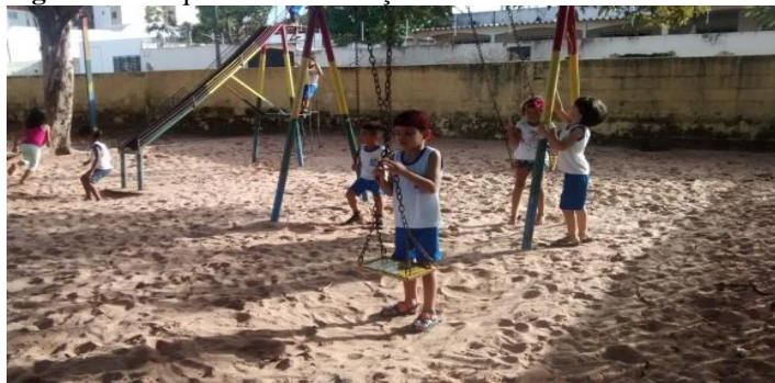
Figura 7 - Parquinho da instituição estudada