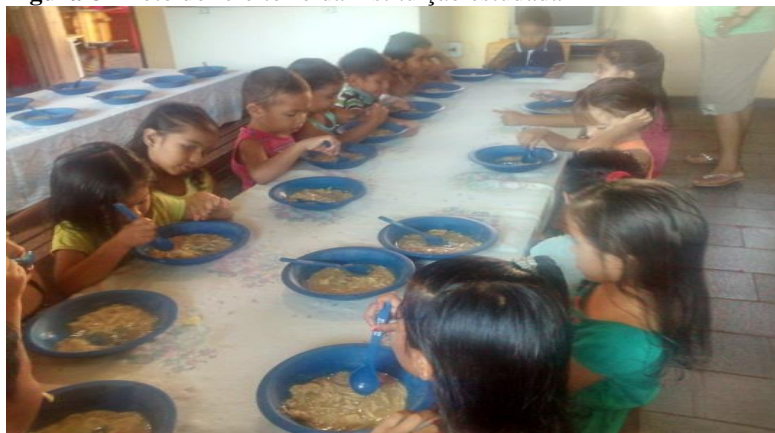
Figura 8 - Foto do refeitório da instituição estudada