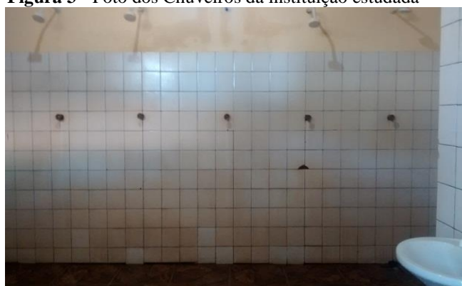
Figura 3 - Foto dos Chuveiros da instituição estudada

A estrutura dos banheiros é antiga e precisa ser reformada, pois a lajota está se deteriorando e com aspecto de sujeira, fazendo com que a hora do banho não seja muito atrativa. Podemos verificar essas informações pelas imagens abaixo: