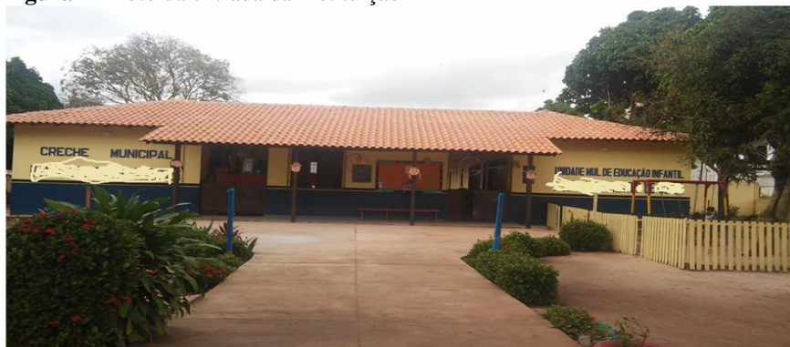
Figura 2 - Foto da entrada da Instituição

17