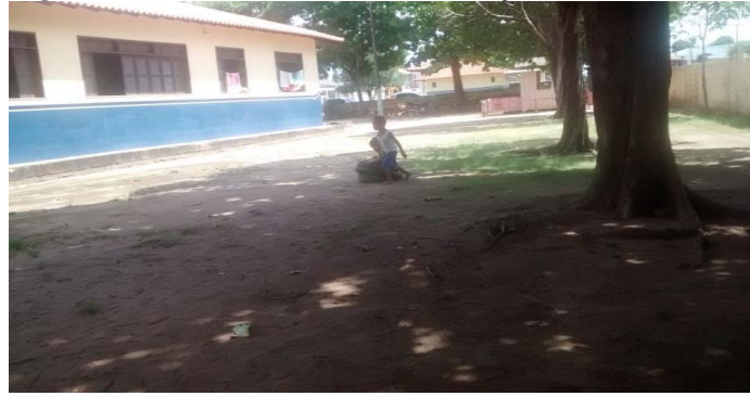
Figura 6 - Foto da área externa da instituição estudada