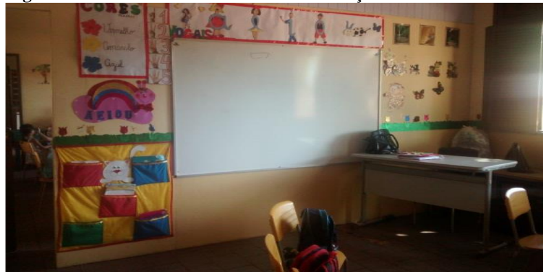
Figura 5 - Foto da sala de atividades da instituição estudada

Algumas salas são protegidas com um material fixado nas colunas para que não recebam a luz do sol à tarde, o que acontecia também com a turma de Pré I, que fica na sala adaptada ao lado do refeitório. Todavia, essa turma possui um ar-condicionado (comprado com a coleta dos pais), que alivia o clima quente. Sempre que necessário, as janelas são abertas para ventilação para evitar que a sala fique quente e abafada. Quanto ao espaço, podemos dizer que é inadequado para disponibilizar cantinhos de atividades ou mesmo realizar uma boa atividade coletiva, visto que não tem espaços para deixar os materiais ao alcance das crianças e todas as mesas e cadeiras dentro da sala, tendo que ser retirada sempre que modificada a rotina.