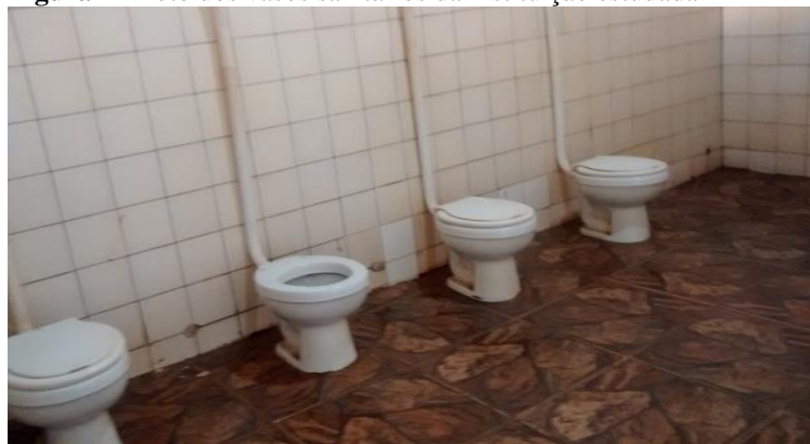
Figura 4 - Foto dos vasos sanitários da instituição estudada