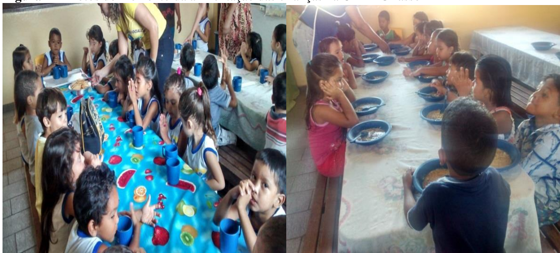
Figura 12 - Fotos do momento da alimentação das crianças na UMEI Girassol

A hora da alimentação não se configura em momento de aprendizagem de bons hábitos alimentares, de como se portar à mesa, comer com autonomia e educação, sem desperdício de alimentos. Para um observador parece que a alimentação é só uma fonte de energia para as crianças continuarem à espera.