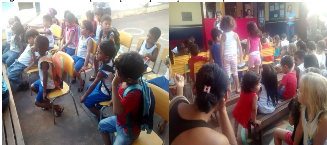
Figura 10 - Foto das crianças em espera de apresentação da instituição estudada