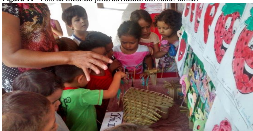
Figura 11 - Foto da excursão pelas atividades das outras turmas

Quando participavam nas apresentações feitas pelas professoras, as crianças ficavam muito felizes e apresentavam um grande interesse pelo produto final, o que não acontecia quando não estavam envolvidas.