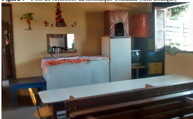
Figura 9 - Foto do refeitório da instituição estudada (sem crianças)