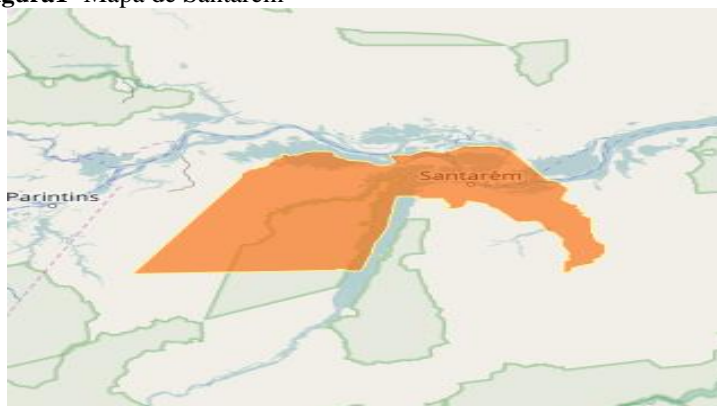
Figura1- Mapa de Santarém

Antes de nos adentrarmos no lócus da nossa pesquisa, lembramos que sua localização influi na contextualização dos dados e da realidade que tratamos mais adiante. Dessa forma, destacamos que o local onde realizamos nosso trabalho é o município de Santarém, situado no oeste do estado do Pará, na região norte do Brasil, sendo um dos mais populosos do estado com estimativa de 294.447 habitantes.