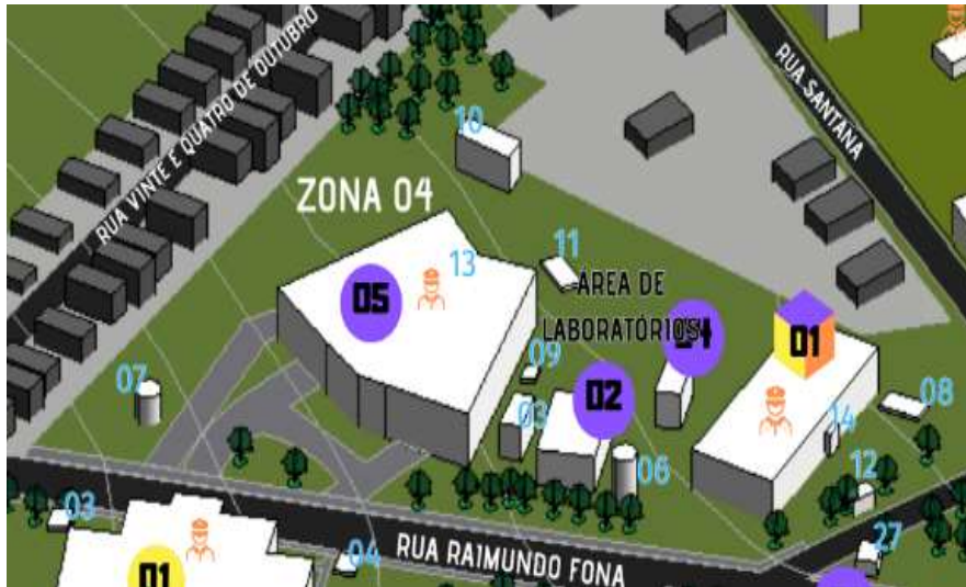
Figura 4. Zona 4 da unidade Tapajós.