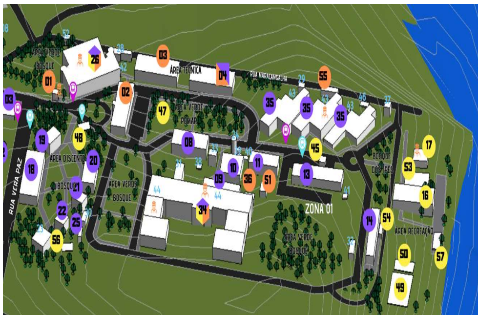
Figura 2: Detalhamento da zona 1 da unidade Tapajós. Os espaços ocupados pelo ICED estão nos blocos 11, 20 e 34. O bloco 34 é o BMT.

A zona 2 é a área verde do Bosque Mekedece, já a zona 3 constitui-se com o restaurante universitário (RU) (Figura 3). A zona 4 inclui o núcleo tecnológico de laboratórios (NTL) e o núcleo tecnológico de bioativos (NTB) (Figura 4). No NTL, o ICED ocupa dois espaços que totalizam 128,90m 2