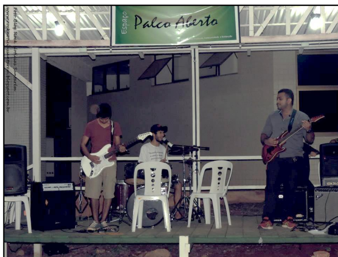
Figura 2. Alunos da UFOPA tocando no “Sarau do IEG”, no projeto “Palco aberto”, em 4 de março de 2015.

De grande importância para a gestão cultural na Universidade, em 20 de março de 2015 foi aprovado, junto ao Conselho Superior Universitário – Consun, o Plano de Cultura da UFOPA, com vigência de dois anos, entre setembro de 2015 e agosto de 2017. O processo foi coordenado pela Pró-Reitoria da Cultura, Comunidade e Extensão, PROCCE, através da sua Diretoria de Cultura, e buscou ser o mais participativo e democrático possível, seguindo as diretrizes da elaboração dos planos de cultura dos municípios brasileiros. Neste contexto foram realizadas rodas de conversas e diversas reuniões com todas as Unidades Acadêmicas e Administrativas, com estudantes e sociedade civil, além da participação do Comitê de Cultura da UFOPA, responsável, entre outras atribuições, pela análise dos projetos, programas e ações apresentados para compor o Plano.