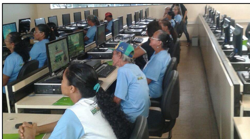
Figura 11. Participantes da oficina “Aplicativos Móveis para a 3ª idade”, ministrada pelo SENAC durante o I Salão de Extensão da UFOPA.