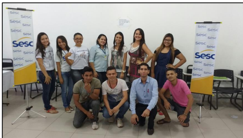
Figura 10. Participantes da oficina “Saúde e Sexualidade”, ministrada pelo SESC durante o I Salão de Extensão da UFOPA.