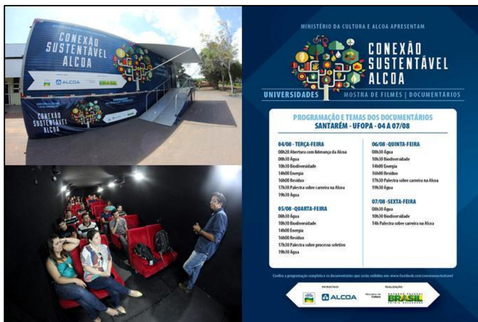
Figura 13. Cinemóvel e cartaz de divulgação do “Conexão Sustentável Alcoa”.

programação incluiu apresentações teatrais, sessões de cinema e oficinas de reciclagem.