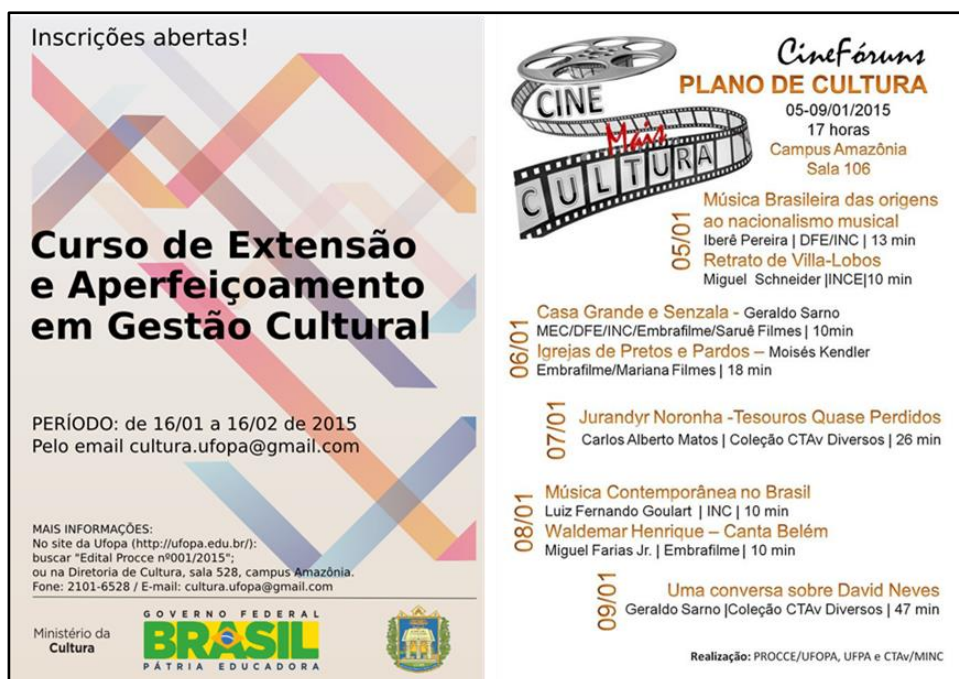
Figura 3. Cartazes de ações culturais promovidas pela PROCCE em 2015: “Curso de Extensão e Aperfeiçoamento em Gestão Cultural” e “Cine Mais Cultura”.