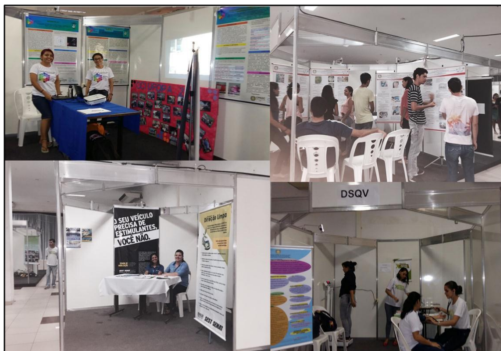
Figura 12. Exposições em Stands durante o I Salão de Extensão da UFOPA.

Os visitantes do Salão nos dias 09 e 10 de dezembro, no turno da tarde, puderam prestigiar, além das apresentações de trabalhos, exposições em 20 estandes medindo 9 m 2 cada, realizadas pelas unidades acadêmicas e administrativas da UFOPA e por parceiros externos, tais como o SEST/SENAT, o SENAC, o SESC e a Escola do Parque (Figura 12).