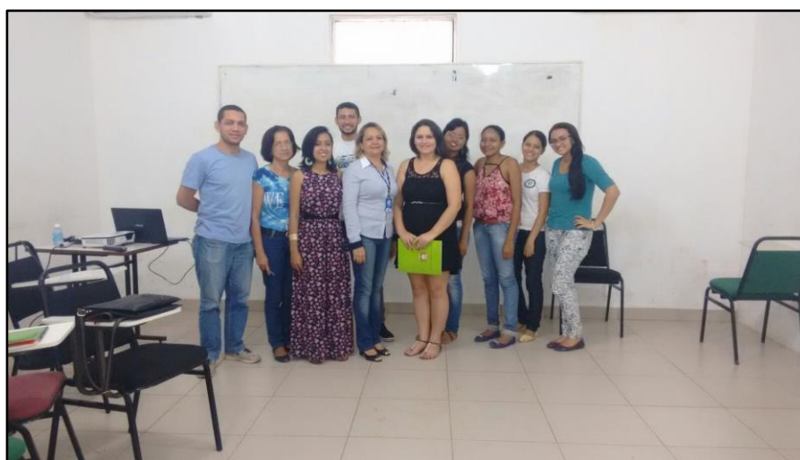
Figura 9. Participantes da oficina “Formalização do Microempreendedor Individual”, ministrada pelo SEBRAE durante o I Salão de Extensão da UFOPA.

Durante o I Salão de Extensão, também foram oferecidas oficinas, palestras e um curso, ministrados por docentes da UFOPA ou por meio de parcerias externas, com vagas abertas para a comunidade acadêmica e externa à UFOPA (Figuras 9, 10 e 11). Os resultados destas atividades estão sistematizados no Quadro 11.