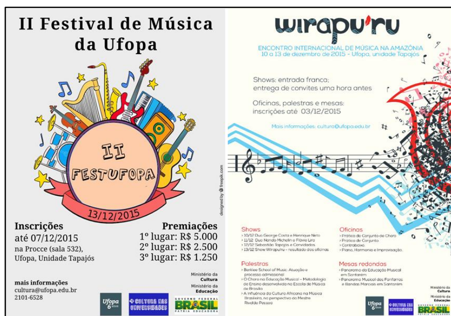
Figura 5. Cartazes de ações culturais promovidas pela PROCCE em 2015: “II Festival de Música da UFOPA” e “Wirapu’ru - Encontro Internacional de Música na Amazônia”.

Entre os meses de fevereiro e junho, em parceria com o Ministério da Cultura, a PROCCE ofertou o Curso de Extensão e Aperfeiçoamento em Gestão Cultural (Figura 6), com o objetivo principal de capacitar gestores públicos, conselheiros e agentes culturais da região Oeste do Pará, a fim de desenvolver competências e