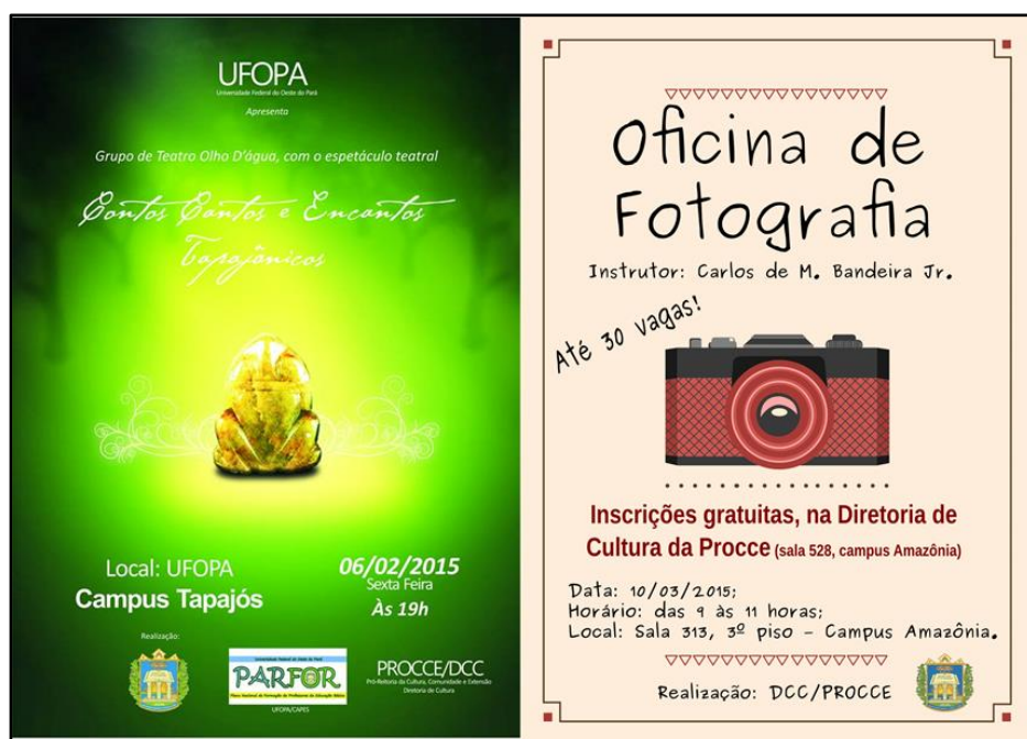
Figura 4. Cartazes de ações culturais promovidas pela PROCCE em 2015: “Espectáculo Contos, Cantos e Encantos Tapajônicos” e “Oficina de Fotografia”.