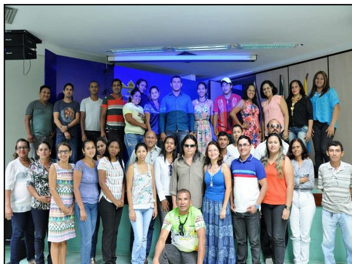
Figura 6. Alunos da aula inaugural do Curso de Extensão e Aperfeiçoamento em Gestão Cultural (Minc/UFOPA)

habilidades voltadas para o acesso às políticas de cultura, valorização da cultura regional e local, e consolidação do Sistema Nacional de Cultura na região.