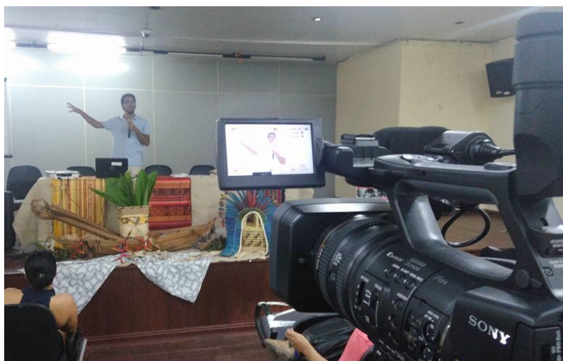
Figura 5. : Registro de evento pelo Estúdio