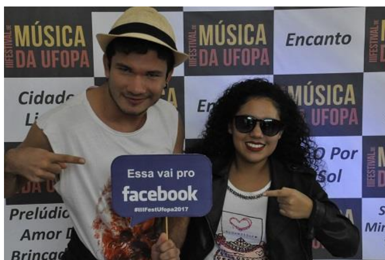
Figura 12. Mural do III FestUfopa

No dia do Festival também foi realizado o “Esquenta FestUfopa”, que contou com Torneio de Karaokê, jogos de damas, xadrez e totó, além de vendas de comidas e bebidas.