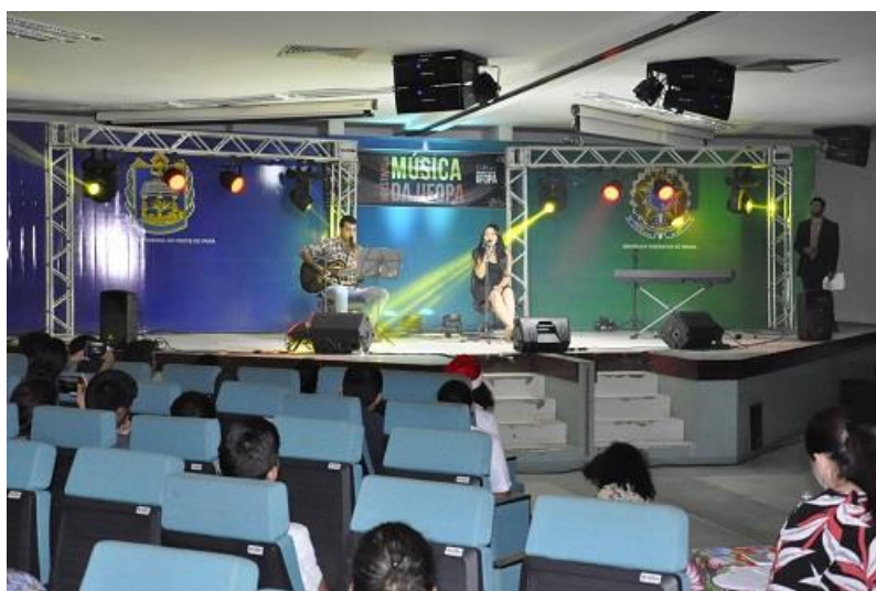
Figura 15. Apresentação de finalista