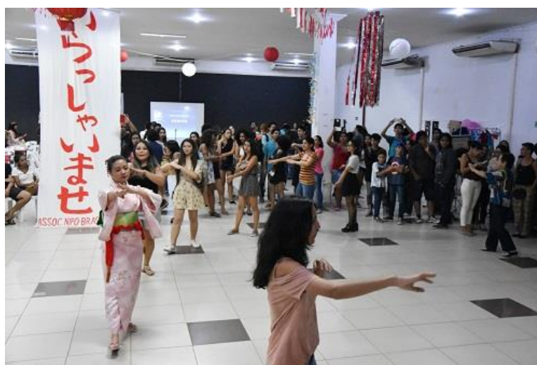
Figura 11. Apresentação de bondori realizada durante a I Semana do Japão.