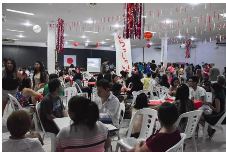
Figura 10. Festival Gastronômico realizado durante a I Semana do Japão.