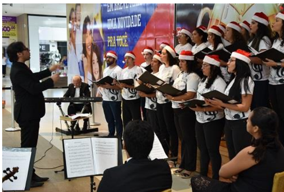
Figura 16. Apresentação de Natal do Coral da Ufopa no Shopping Rio Tapajós