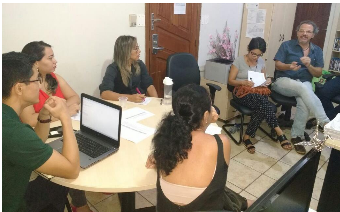
Figura 6. Primeira reunião do NPD (9/10/2017)

Em outubro de 2017, foi realizada a prospecção de parceiros e envio de ofícios para representantes de instituições públicas e privadas, além de entidades da sociedade civil para colaboração na implementação do NPD. Optou-se por priorizar instituições de ensino e grupos que trabalham com atividades culturais, fotografia, audiovisual e comunicação. Houve uma série de reuniões para apresentação dos objetivos do NPD ( Figura 6 ) e elaboração do Plano Anual de Ações para 2018. O documento, produzido coletivamente, deverá ser enviado para o MinC até março deste ano.