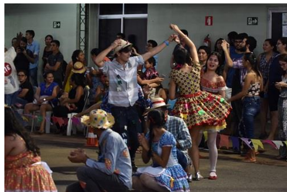
Figura 8. Registros da Festa Junina da Ufopa 2017.