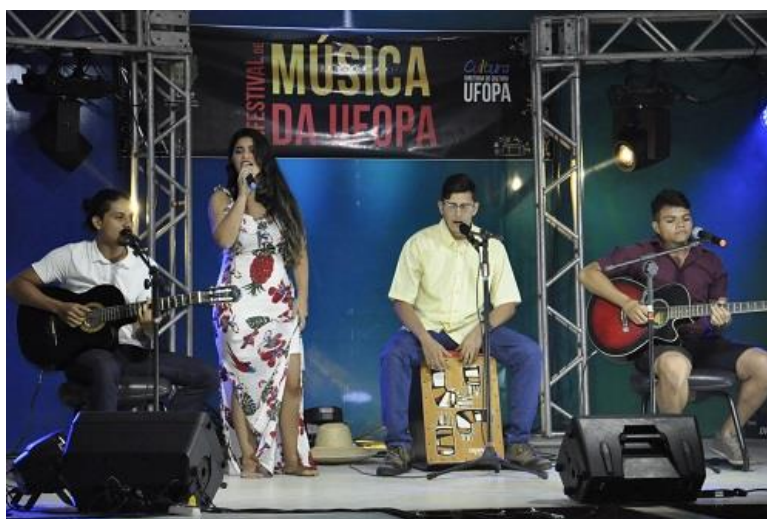
Figura 14. Vencedores do 3º lugar – III FestUfopa