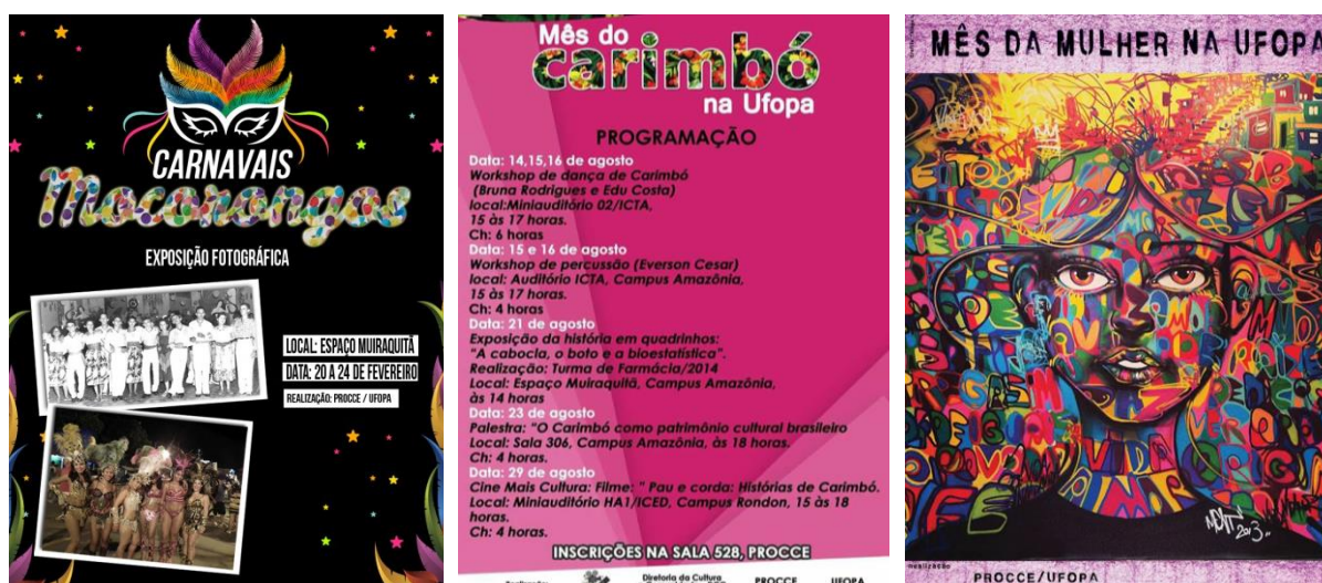
Figura 7. Cartazes das programações temáticas da DCC em 2017.

A DCC promoveu 36 eventos e ações culturais, dentre exposições fotográficas, mesas redondas, exhibições de filmes, workshops, oficinas, feiras, painel e apresentações culturais. Parte das ações integraram programações temáticas, como “Carnavais Mocarongos”, “Mês da Mulher” e “Mês do Carimbó”. Nestas, as atividades incluíam mostras de cinema, exposições e debates ( Figura 7 ).