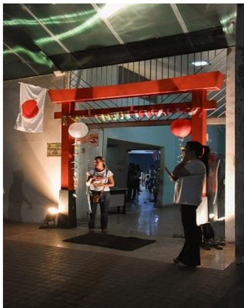
Figura 9. Decoração na entrada do Auditório - I Semana do Japão.