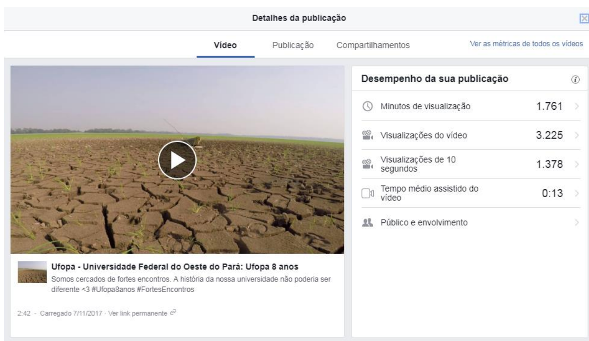
Figura 2. Informações do vídeo "Ufopa 8 Anos" fornecidas pelo Facebook

Em relação à área de áudio, foram produzidos três álbuns musicais com artistas locais. Dessa forma, pretende-se estimular a produção musical local e valorizar talentos na comunidade acadêmica. A gravação, edição, mixagem e masterização foi realizada pelo Estúdio ( Quadro 6; Figuras 3 e 4 ).