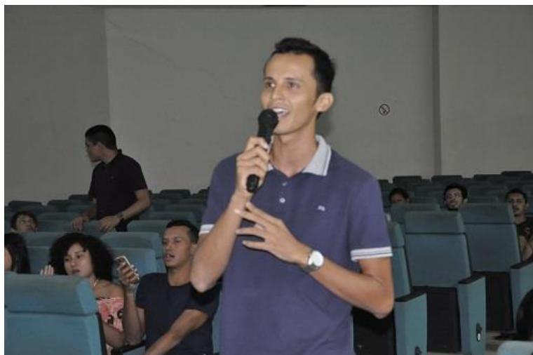
Figura 13. Participante do I Torneio de Karaokê – III FestUfopa