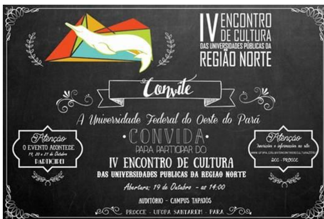
Figura 33. Convite para participação no IV Encontro de Cultura.

http://www.ufopa.edu.br/noticias/2016/julho/ufopa-sedia-iv-encontro-de-cultura-das-universidades-publicas-do-norte