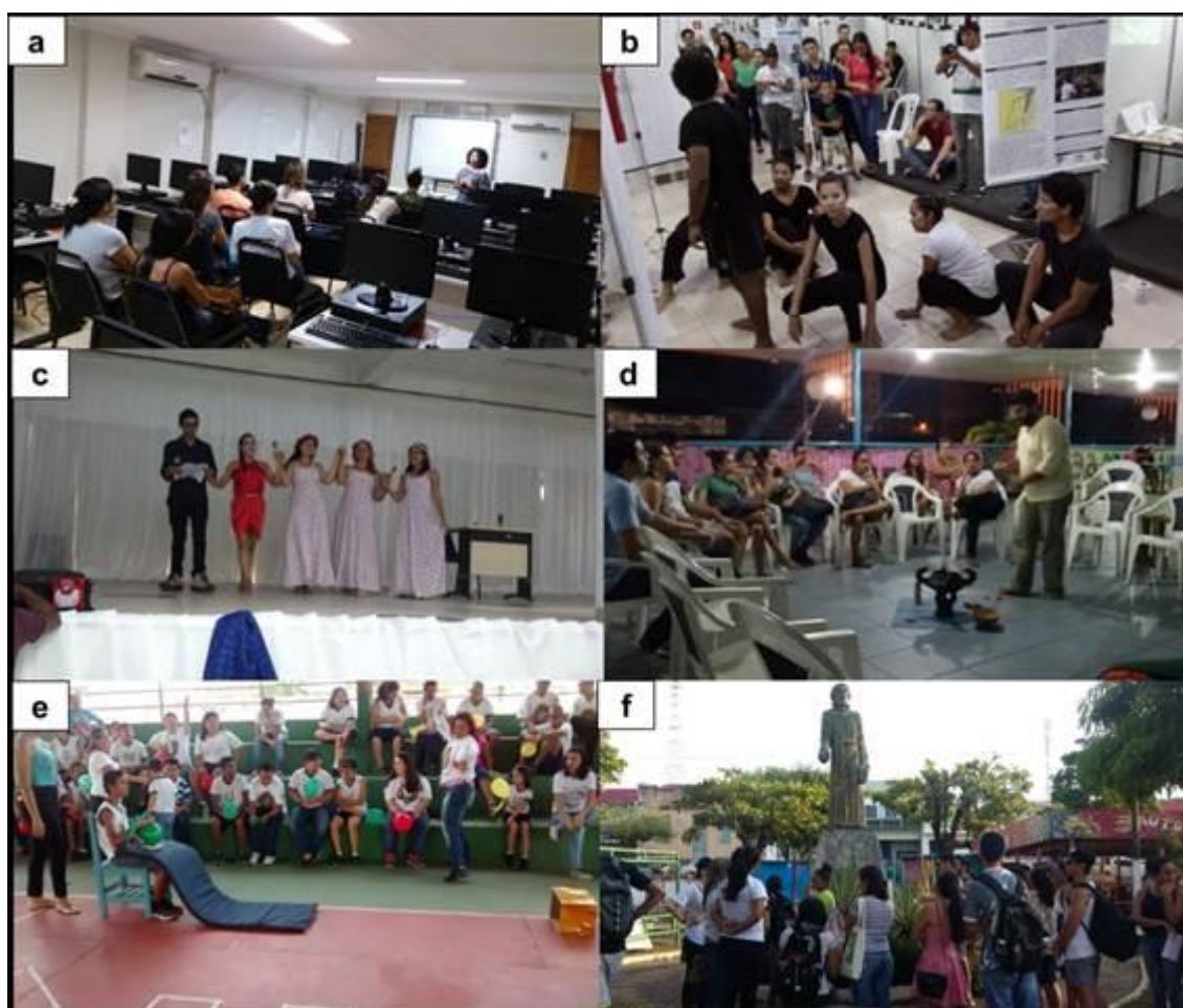
Figura 43. Atividades culturais do II Salão de Extensão da Ufopa. a) Cine debate "A greve"; b) Apresentação do grupo de teatro "Iurupari", c) Apresentação "Viajando pelos mares da literatura"; d) Contação de histórias sobre mitos e lendas amazônicas; e) Gincana "Patrimônios Culturais e Inclusão",