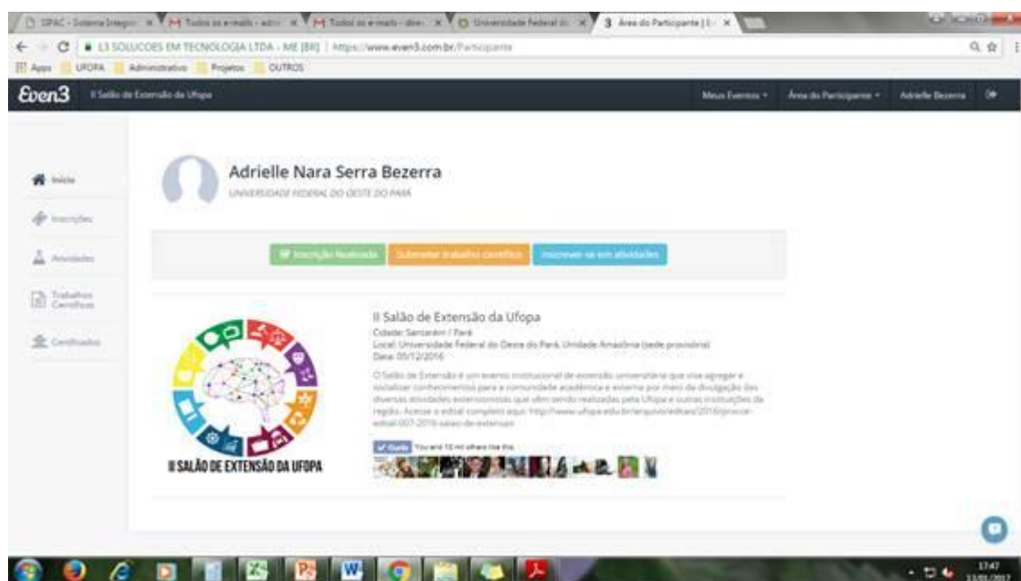
Figura 39. Página inicial (perfil do participante) do site even3.com.br/salaoufopa2016 , utilizado para o gerenciamento das inscrições de participantes e da submissão e avaliação dos trabalhos no II Salão de Extensão da Ufopa.

Por meio do Edital Procce nº 007/2016, foram estabelecidas as normas para participação no evento e o cronograma para submissão e avaliação de resumos expandidos e inscrições nas atividades específicas, tais como oficinas e minicursos. Foi criado um cadastro no site even3.com.br/salaoufopa2016 para o gerenciamento das inscrições e para a submissão e a avaliação de resumos expandidos. As figuras 39 e 40 mostram a página inicial do site com acesso pelo perfil do participante e do organizador, respectivamente.