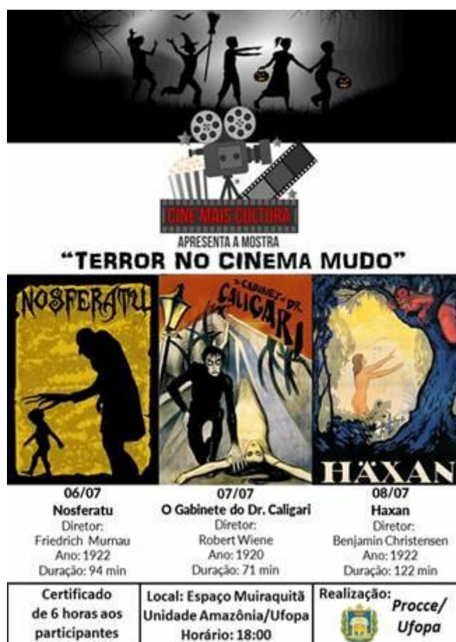
Figura 16. Cartaz de divulgação da mostra “Terror no Cinema Mudo”, promovida pelo Projeto Cine Mais Cultura.