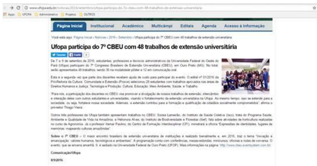
Figura 53. Divulgação da participação da Ufopa no 7º Cbeu.

O 8º Congresso Brasileiro de Extensão Universitária será sediado na cidade de Natal, Rio Grande do Norte, a ser organizado pela Universidade Federal do Rio Grande do Norte (UFRN), para o qual esta Pró-Reitoria preverá recursos para viabilizar a ida de estudantes da graduação da Ufopa.