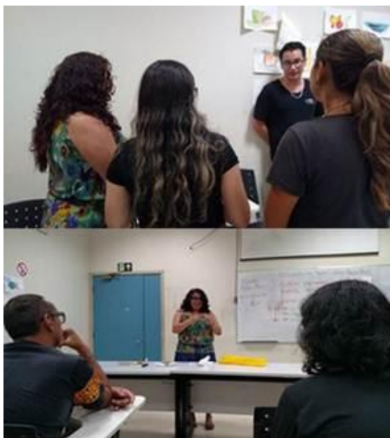
Figura 27. Oficina de teatro de objetos.