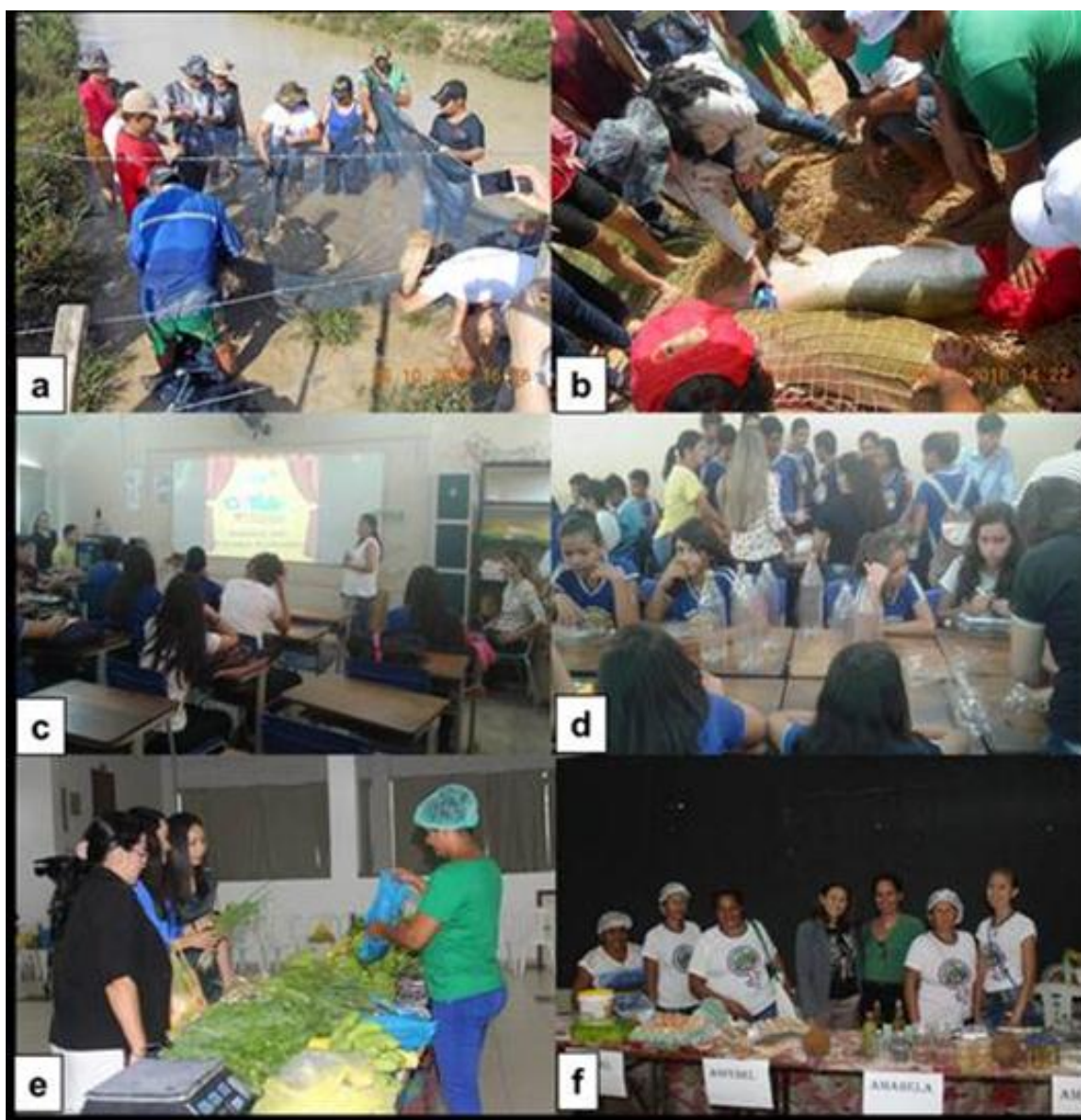
Figura 49. Registro de ações realizadas no âmbito de projetos de extensão. a) Curso de manejo alimentar e b) Curso de manejo de pirarucu, ambos realizados no âmbito do Projeto “Rede Acquapacita”; c) e d) ações do Projeto “Estudo das Condições de Funcionamento e Operação dos Sistemas de Saneamento Básico da Área Urbana do Município de Santarém-PA”; e) e f) Feira da Agricultura Familiar, realizada pelo Projeto “Incubadora de Empreendimentos Solidários”.