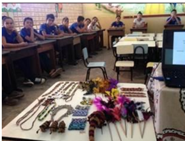
Figura 3. Exposição de artesanato indígena, na escola Nossa Senhora do Perpétuo Socorro.