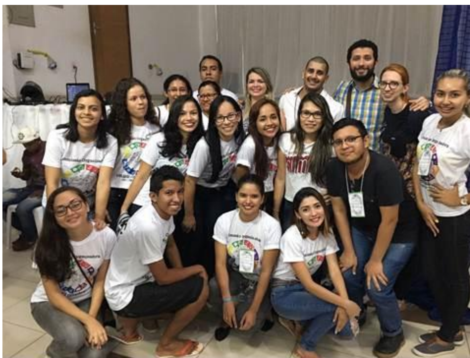
Figura 41. Parte da comissão organizadora e da equipe de voluntários do II Salão de Extensão da Ufopa.