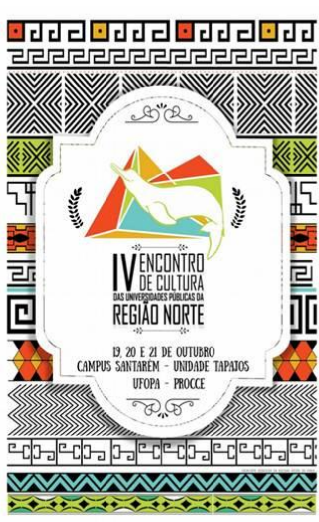
Figura 35. Cartaz de divulgação do IV Encontro de Cultura das Universidades Públicas da Região Norte.