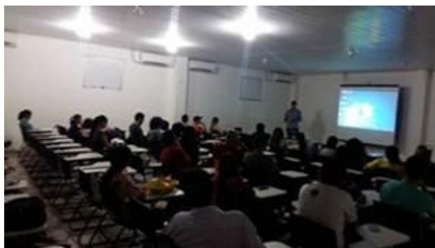
Figura 12. Bate-papo com o cineasta Emano Loureiro, dia 28 de julho, após exibição do seu filme “Meu tempo menino”.