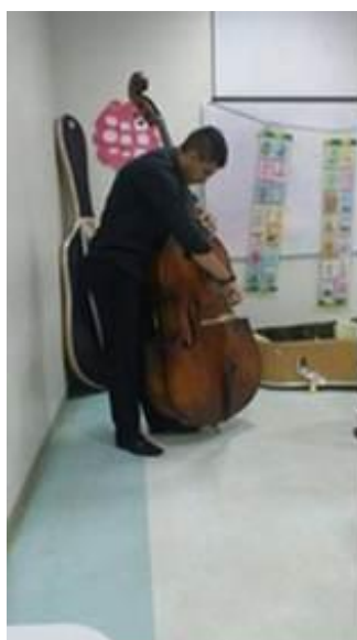
Figura 30. Oficina de Prática de Conjunto em Música Popular.