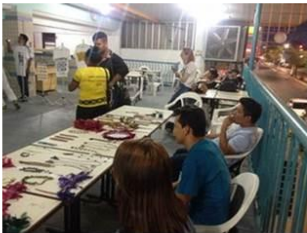
Figura 7. Exposição de arte indígena no encerramento do projeto.