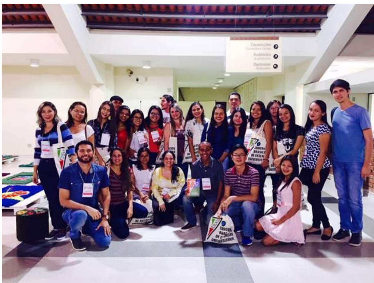
Figura 50. Discentes e servidores da Ufopa que participaram do 7º Cbeu.