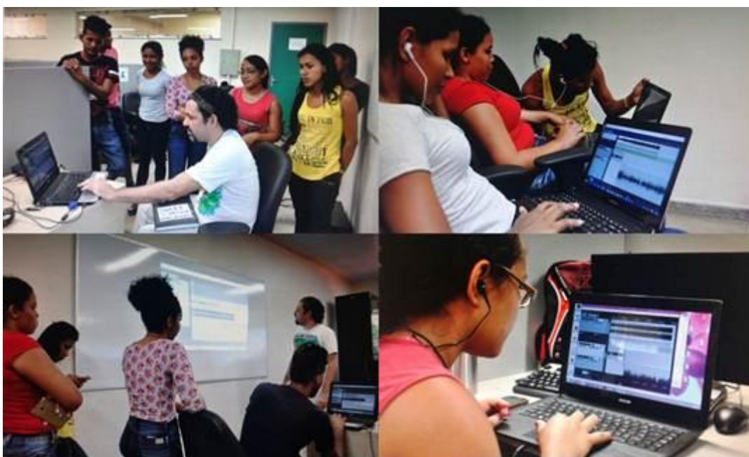
Figura 36. Áudio Digital para Produção Fonográfica.

A oficina tratou de quatro etapas da produção de áudio – gravação, edição, mixagem e masterização, utilizando os softwares Audacity (editor de áudio) e Reaper (gravação multipista). A carga horária foi de 20 horas, e aconteceu do dia 3 a 7 de outubro.