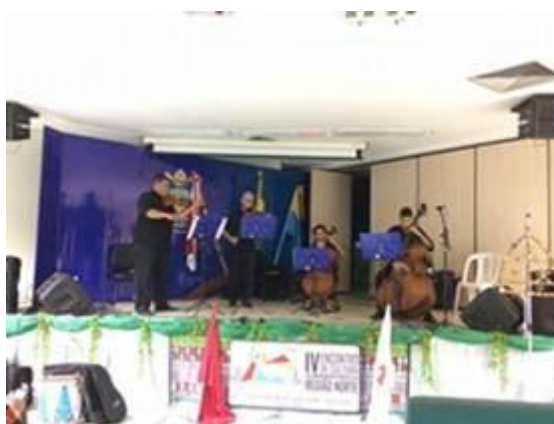
Figura 21. Apresentação do Quarteto de Cordas da Universidade Federal do Acre, no dia 19 de outubro.