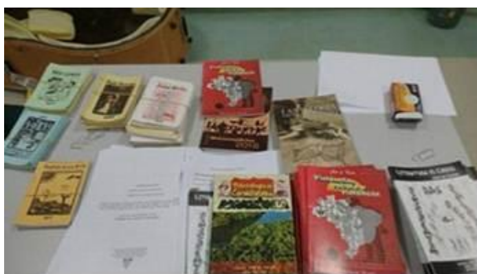
Figura 29. Sala de aula da oficina de “Literatura de Cordel”.