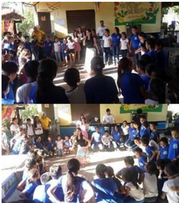
Figura 5. Apresentação musical com carimbós, na escola Nossa Sra. do Perpétuo Socorro.