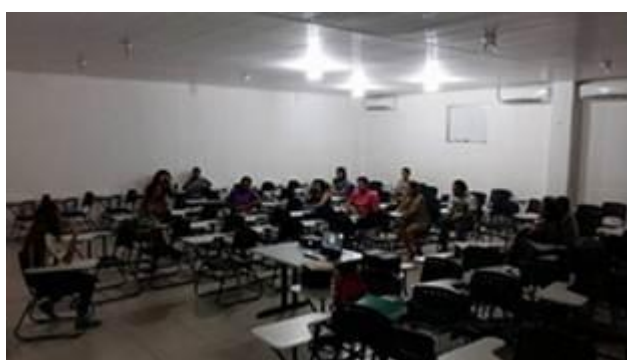
Figura 13. Bate-papo com a diretora Alanda Matos, dia 21/07, após a exibição de “Caminhos – somos todos borboletas”.