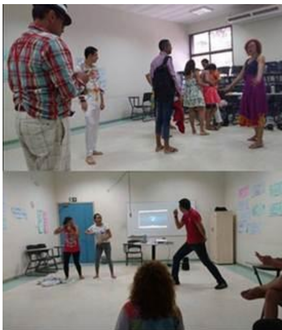
Figura 28. Oficina “Cenas e encenações do Teatro Popular Paraense”