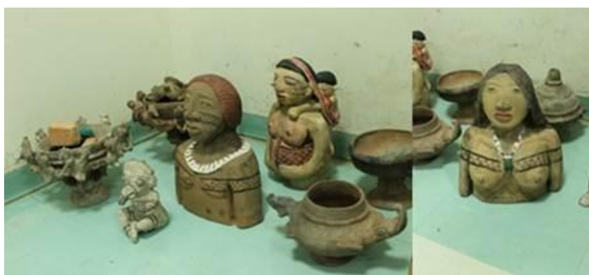
Figura 32. Peças que compuseram a exposição de cerâmicas do artista plástico santareno Paulo Nascimento.