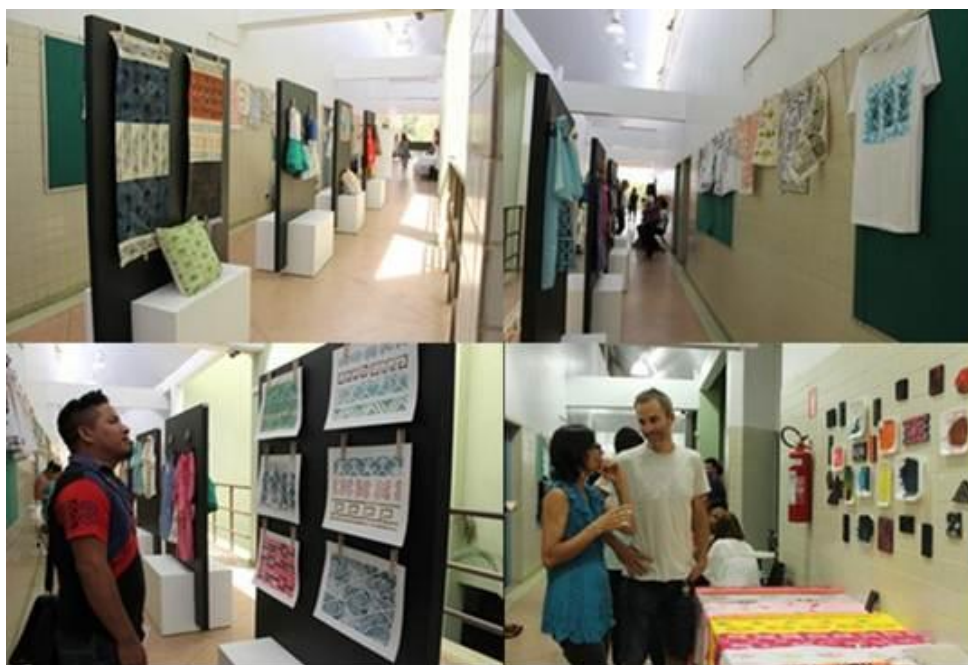
Figura 31. Exposição do Projeto Quatiara.

de Cultura das Universidades Públicas da Região Norte; O brincar na comunidade de várzea Tapará Grande; Ensaio de uma cartografia sígnica na arte amazônica; Análise do curso de extensão em gestão cultural realizado em Roraima; A participação de adolescentes em grupos artístico-culturais no bairro da pedra, em Belém/PA; Economia criativa e política cultural: Reflexões e contribuições para a elaboração do Plano Municipal de Cultura de Belém.