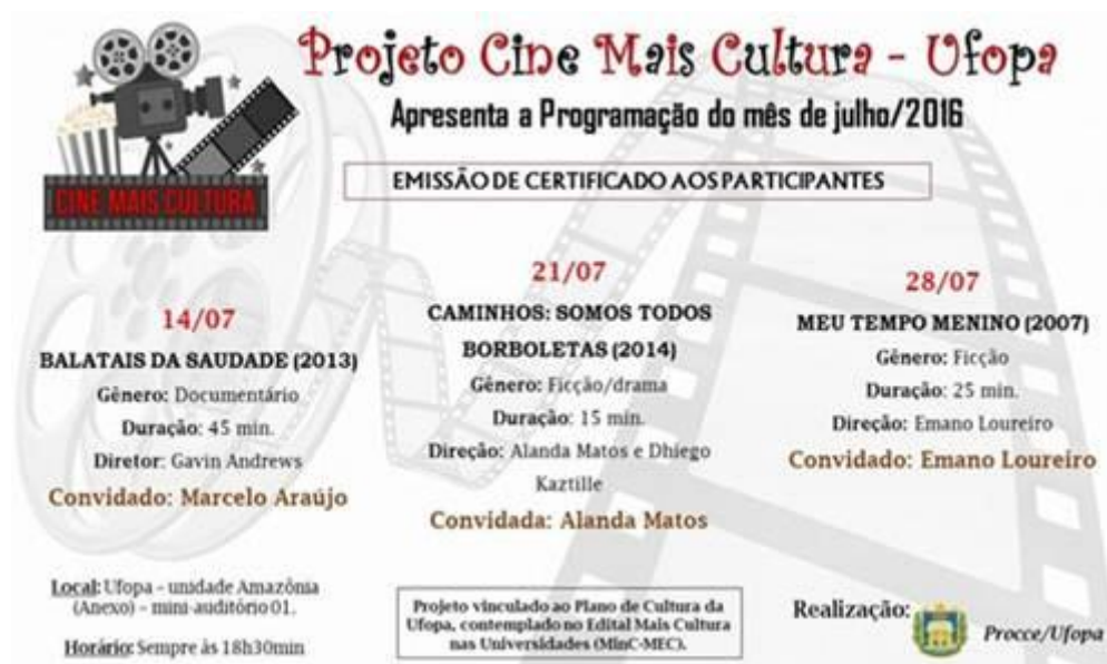
Figura 15. Cartaz de divulgação da programação de julho do Projeto Cine Mais Cultura.