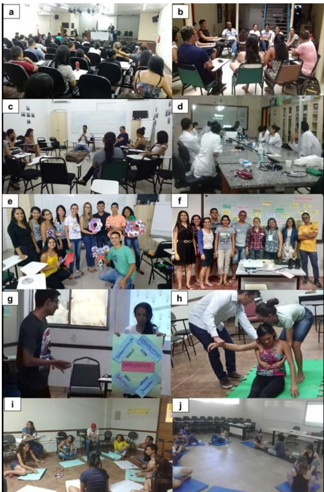
Figura 44. Atividades realizadas durante a programação do II Salão de Extensão da Ufopa: a) Palestra de abertura, com o Prof. Dr. Djacy Ribeiro, Pró-Reitor de Extensão da Ufra; Rodas de conversa: b) Matriz de Competência para atuação clínica do farmacêutico e c)

realizada na Apae; f) Excursão Patrimônio Histórico Arquitetônico de Santarém, realizada nas ruas do centro de Santarém.