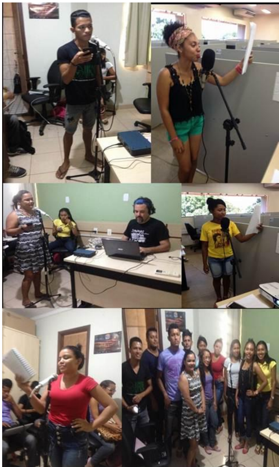
Figura 38. Atividades do Estúdio de Áudio e Vídeo.