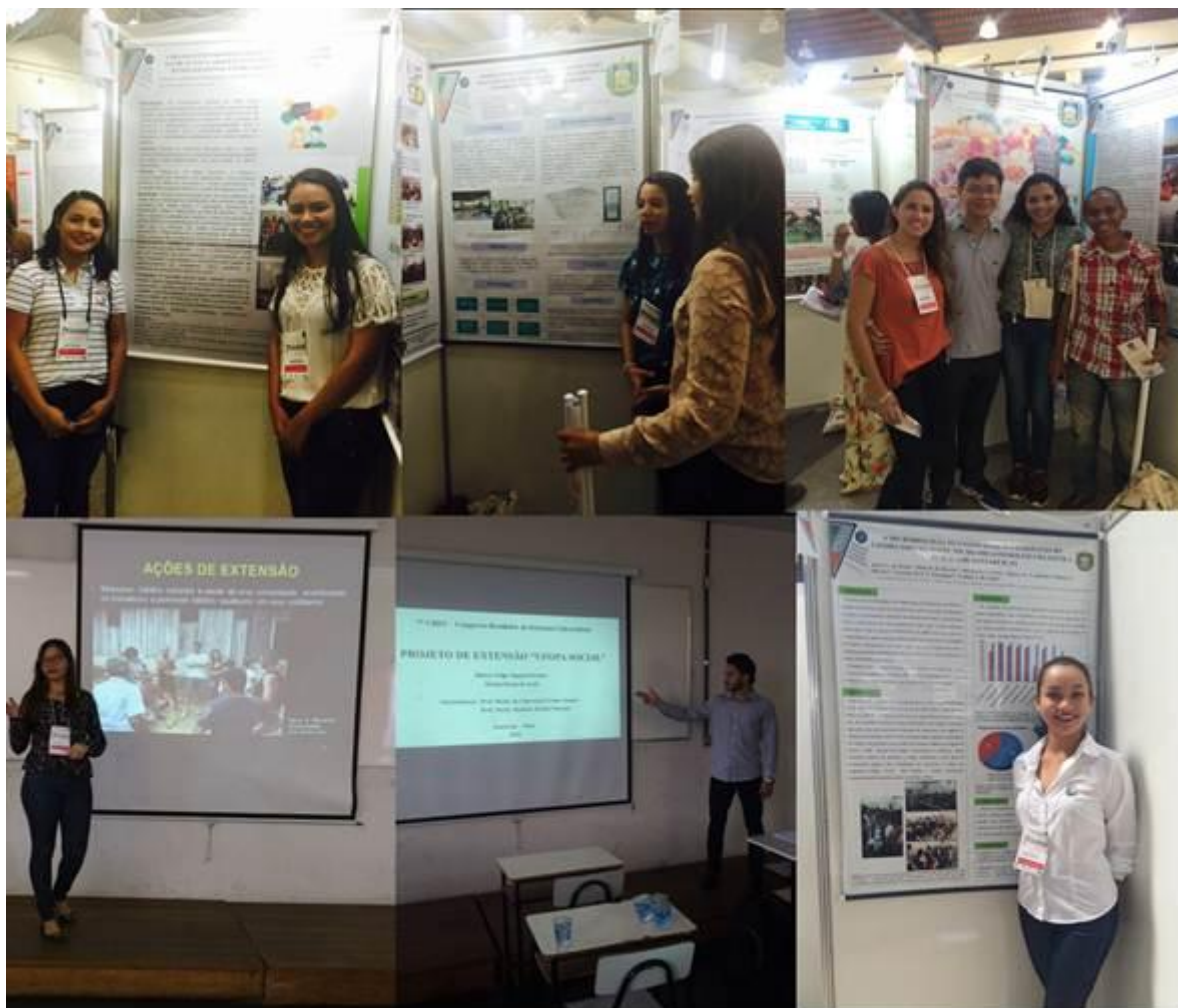
Figura 51. Registros da participação dos discentes da Ufopa no 7º Cbeu.