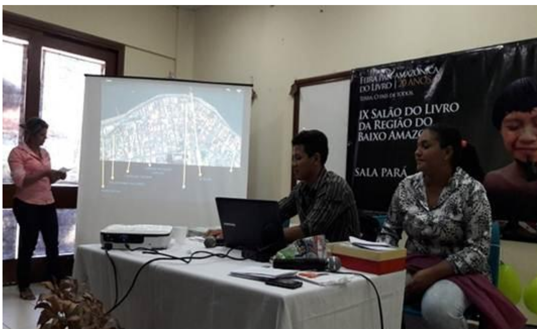
Figura 18. Participantes do Projeto Cultura, Identidade e Memória na Amazônia apresentado a Gincana Educativa no IX Salão do Livro.