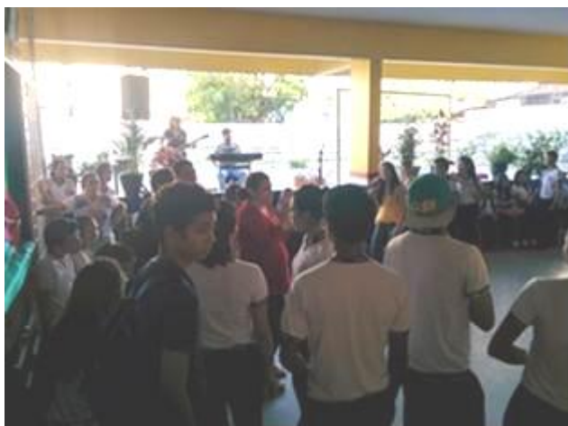
Figura 10. Apresentação musical na escola Onésima Pereira de Barros, dia 15 de abril.