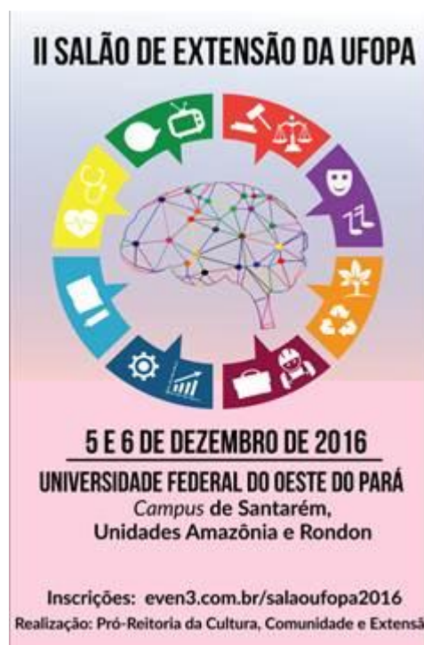
Figura 42. Cartaz produzido para divulgação do II Salão de Extensão na Ufopa e em diversas instituições de Santarém. Arte: Williana Rêgo Pereira.