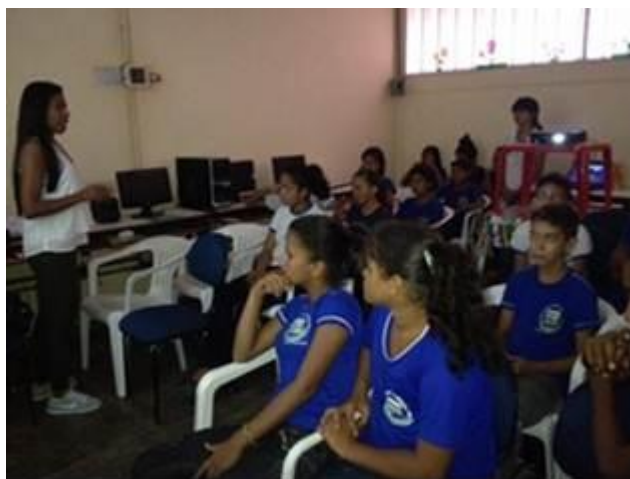
Figura 4. Bate-papo após exibição de filme sobre capoeira, na escola Perpétuo Socorro.