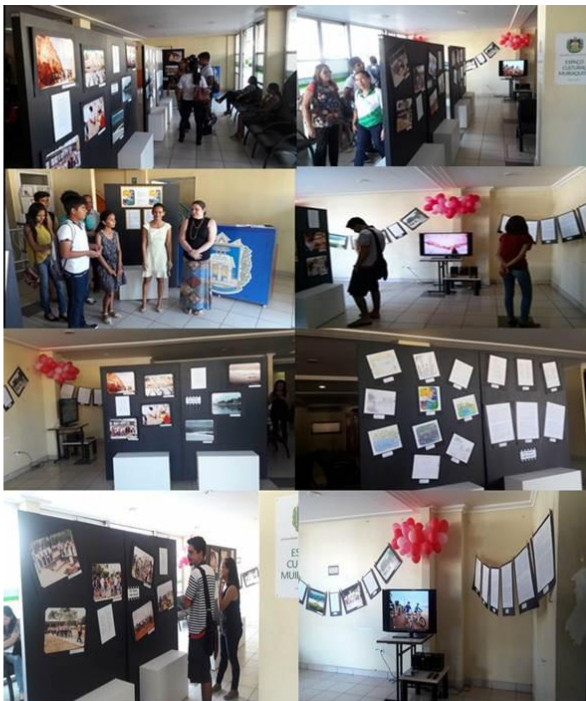
Figura 2. Fotos da Exposição Geodiversidade Amazônica.