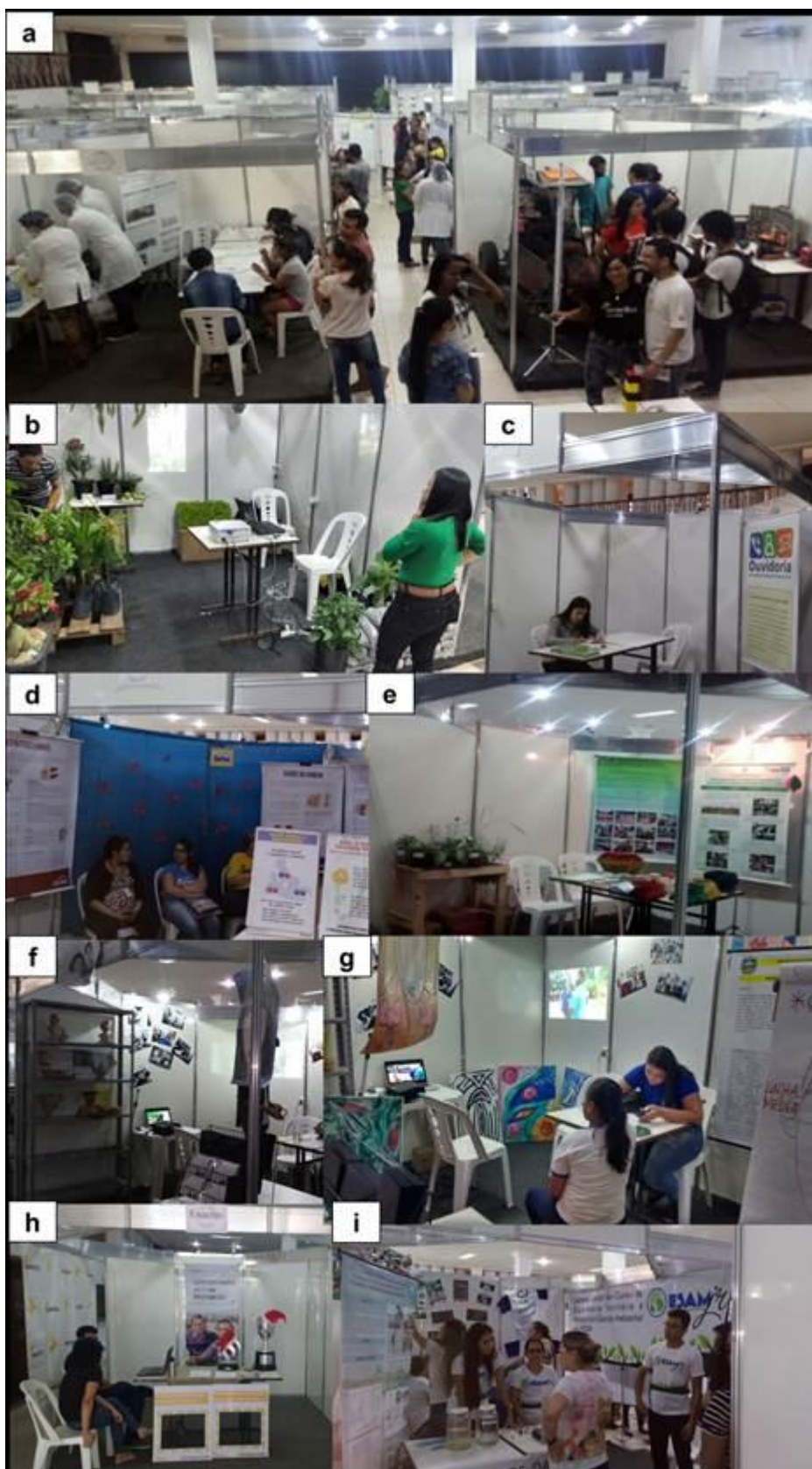
Figura 46. Exposições em estandes durante o II Salão de Extensão da Ufopa: a) Vista geral dos estandes; b) Fazenda Experimental da Ufopa; c) Ouvidoria da Ufopa; d) Atividades de educação em saúde do Sesc; e) Atividades de educação ambiental da Escola do Parque; f) e g) Projeto de Extensão “Memória dos Artesãos de Santarém”; h) Time Enactus Ufopa; i) Empresa Junior Esam Jr.