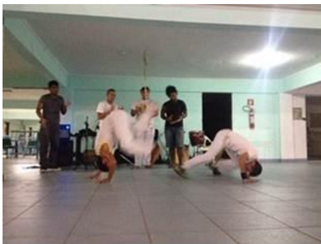
Figura 8. Apresentação de capoeira no dia do encerramento, na unidade Amazônia da Ufopa.