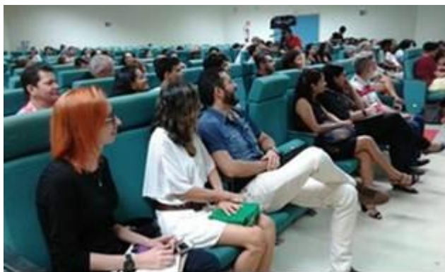
Figura 25. Público do auditório da Ufopa na noite do dia 21 de outubro, durante o IV Encontro.