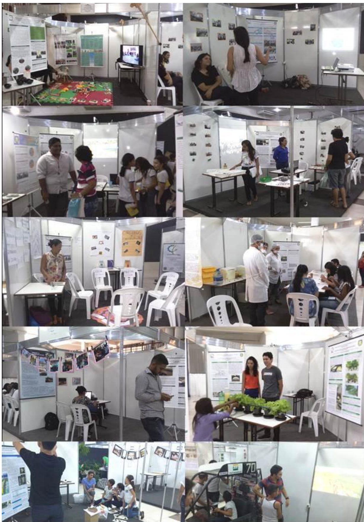
Figura 48. Alguns dos trabalhos de extensão apresentados em estandes durante o II Salão de Extensão da Ufopa, na modalidade mostra interativa+pôster".