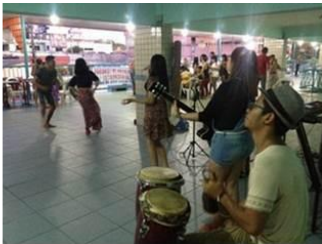
Figura 6. Apresentação musical no show de encerramento do projeto.