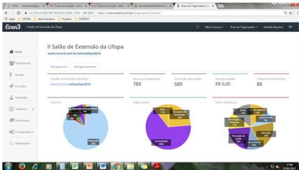
Figura 40. Página inicial (perfil do organizador) do site even3.com.br/salaoufopa2016 , utilizado para o gerenciamento das inscrições de participantes e da submissão e avaliação dos trabalhos no II Salão de Extensão da Ufopa.

A Comissão organizadora do II Salão de Extensão, composta por nove servidores da Procce, foi designada por meio da Portaria Procce nº 143, de 01 de dezembro de 2016. Para auxiliar a comissão organizadora, foram selecionados 27 discentes de cursos de graduação da universidade ( quadro 6 e figura 41 ), os quais atuaram como voluntários em atividades antes, durante e após o evento, tais como: confecção e fixação de cartazes, montagem das pastas e material para credenciamento, organização do auditório para as exposições, apoio aos ministrantes das oficinas e minicursos, às exposições do Salão e à emissão de certificados.