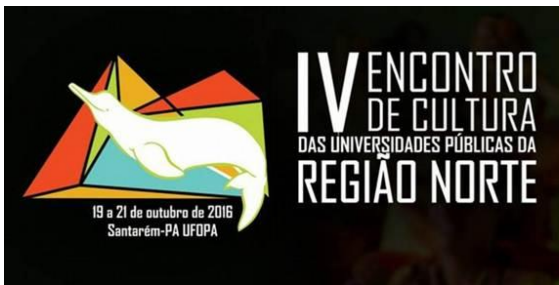
Figura 34. Logo do IV Encontro de Cultura.