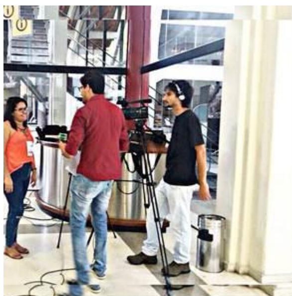
Figura 52. Discente da Ufopa em entrevista à TV Ufop durante o 7º Cbeu.