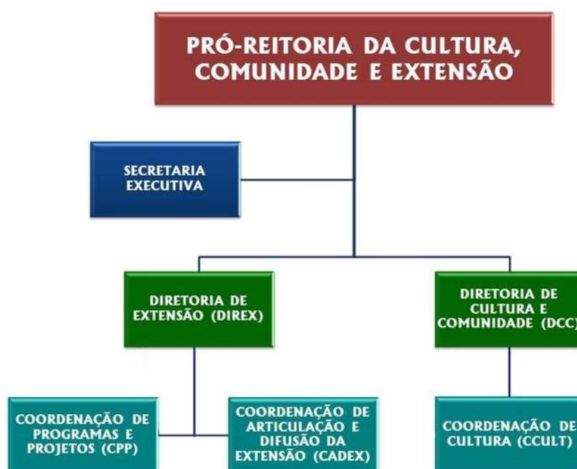
Figura 1 – Organograma da Procce

A Pró-Reitoria da Cultura, Comunidade e Extensão – Procce, foi implantada em 2013 com o objetivo de planejar, executar, coordenar e avaliar, de forma integrada, as ações de Cultura e Extensão, propiciando a integração do Ensino, Pesquisa e Extensão na Universidade Federal do Oeste do Pará - Ufopa. Considerando que a Ufopa apoia-se nos princípios da universalidade do conhecimento, do fomento à interdisciplinaridade e da valorização das práticas regionais, a Procce visa, por meio de suas ações, aproximar esta instituição aos diferentes segmentos da sociedade. Em sua estrutura organizacional, a Procce conta com duas Diretorias e três coordenações, conforme o organograma a seguir: