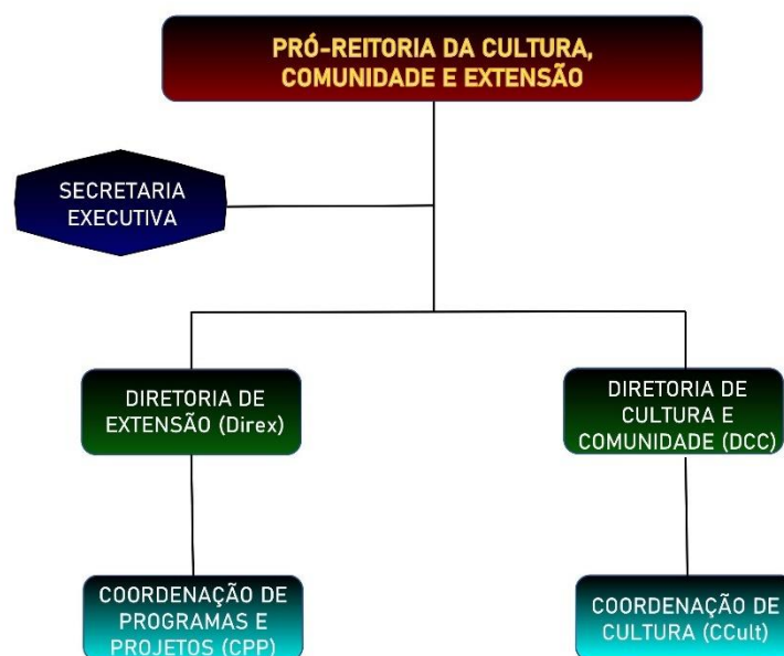
Figura 1 – Organograma da Procce

Considerando que a Ufopa se apoia nos princípios da universalidade do conhecimento, do fomento à interdisciplinaridade e da valorização das práticas regionais, a Procce visa, por meio de suas ações, aproximar esta instituição aos diferentes segmentos da sociedade. Em sua estrutura organizacional, a Procce conta com duas Diretorias e duas coordenações, conforme o organograma a seguir: