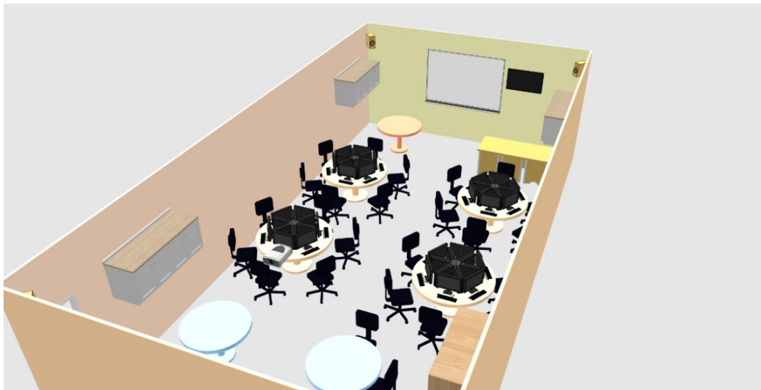
Figura 2: Visualização superior tridimensional do laboratório

Em linhas gerais, o layout foi desenvolvido pensando nas possíveis atividades que professores e alunos da instituição podem propor no âmbito do ensino, da pesquisa e extensão. Um dos principais propósitos do laboratório é servir como ambiente multifuncional que contribua com a inovação dos métodos e processos pedagógicos mediados pelas tecnologias de informação e comunicação. Além disso, pensou-se na necessidade de organizar