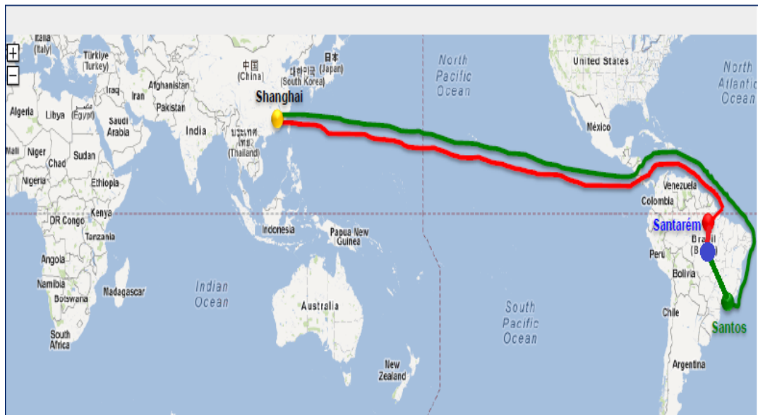
Figura 2 - Fluxo marítimo comparativo entre portos de Santarém (PA) e Santos (SP).

MRN, ALCOA e Rio Tinto; Fábrica de Polpas e Concentrados de Produtos da Amazônia como açaí e cupuaçu, em Óbidos; Projeto TRAMOESTE, com transmissão de energia elétrica, pelo linhão de Tucuruí, para os municípios da margem direita e esquerda do rio Amazonas; Complexo Hidroelétrico da mesorregião Sudoeste; Ampliação do porto de Santarém e Criação da Plataforma Logística para Grãos e Produtos da Zona Franca de Manaus, em Santarém, Belterra e Itaituba; Expansão do Turismo, Ampliação do Aeroporto de Santarém e a Instalação de uma Fábrica de Cimento, entre outros projetos já implantados, como o cultivo e escoamento da soja pelo porto de Santarém. A Figura 2, a seguir, mostra a rota de escoamento da soja, produzida no Centro Oeste, até o porto de Xangai, com duas opções, através do porto de Santos e através do porto de Santarém, que propicia, apenas pela rota fluvial e marítima uma economia de 7 dias, impactando fortemente no custo final do transporte e conseqüentemente no preço da tonelada dos grãos, dando maior competitividade aos produtos brasileiros.