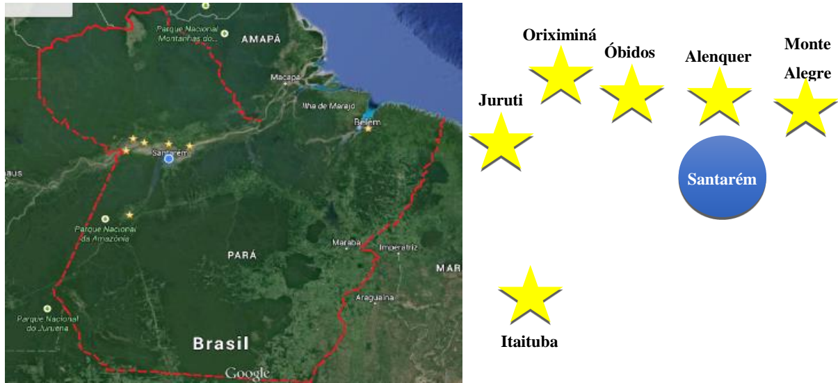
Figura 1 - Localização dos campi da UFOPA.