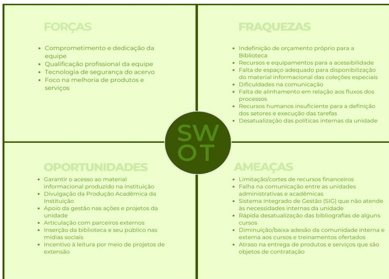
Figura 1 - Matriz SWOT do SIBI/Ufopa

Esta unidade está em fase de elaboração de seu Plano de Gestão de Riscos, com previsão de finalização no exercício de 2024. No entanto, foi possível identificar algumas forças, fraquezas, oportunidades e ameaças que podem afetar a capacidade do Sistema de Bibliotecas para gerar valor em curto, médio e longo prazo, como pode ser observado na Matriz SWOT abaixo, bem como, iniciou-se o trabalho de identificação de alguns riscos/fatores críticos para o SIBI.