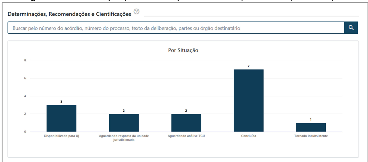
Figura 1 – Determinações, Recomendações e Certificações do TCU para a Ufopa.

As determinações, recomendações e certificações, seus prazos de atendimento e status estão discriminadas no ANEXO 1 , disponível no link: < https://nuvem.ufopa.edu.br/s/afGZAp39zbgafxD >.